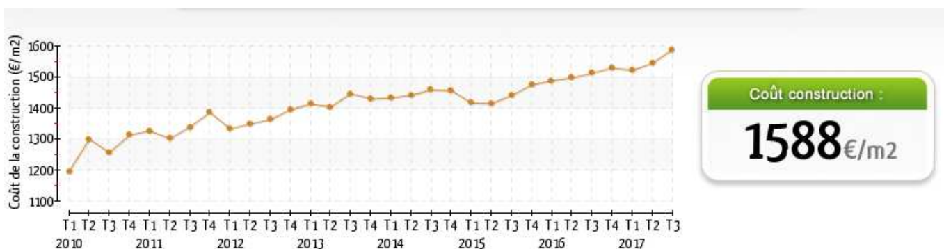
Fig. 2 : Evolution du coût de la construction au mètre carré

« Depuis le début de nos analyses, le budget alloué aux finitions demeure plutôt stable (environ 25 000 euros). En revanche, le coût d'achat du terrain a progressé de 7,46 % en douze mois, passant de 97 280 euros à 104 540 euros), quand le coût de la construction brute progressait de 4,71 % (155 820 euros en 2016, versus 163 160 euros cette année). », analyse Thomas Modolo, Responsable Communication de ForumConstruire.com.